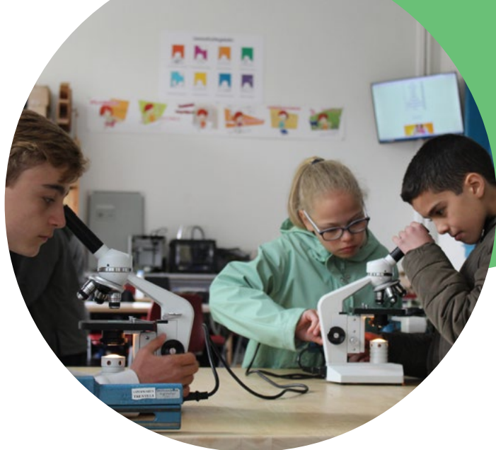
Tijdens de projectweek verkennen de leerlingen de basisoptie STEM-wetenschappen.

Tijdens onze projectweek laten we je proeven van alle mogelijke basisopties die je kunt kiezen in het tweede jaar, ook die buiten BimSem. Misschien ontdek je tijdens deze leuke en lesvrije week wel nieuwe interesses of talenten? Daar hopen we alvast op!